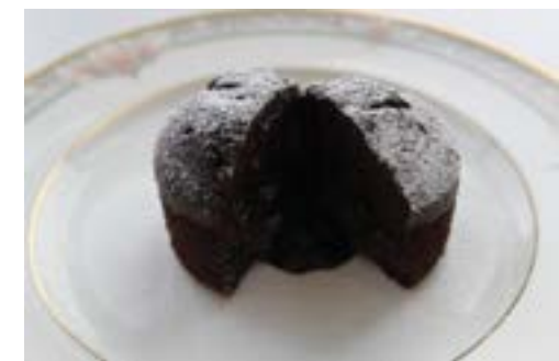
フォンダンショコラ ¥ 550