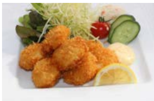
帆立フライ ¥ 950