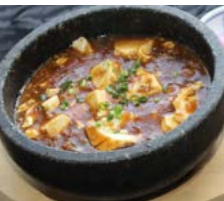
石焼きマーボー ¥ 880