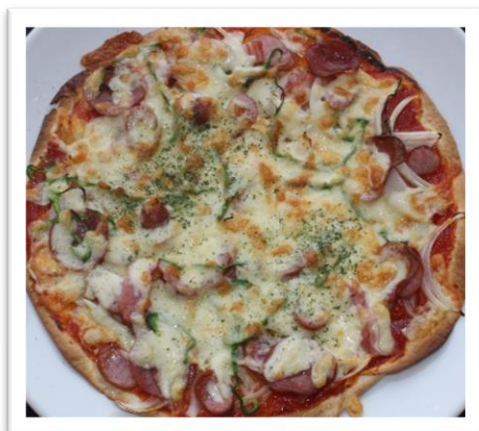
ピザ ¥ 1,540