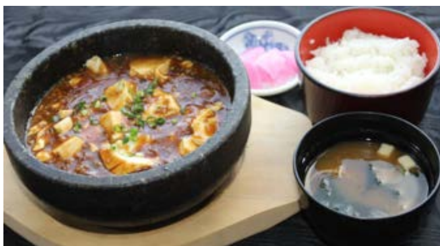
石焼きマアボ一定食