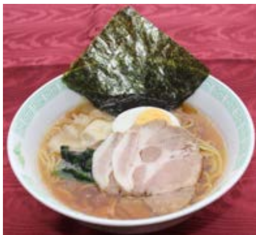
お子様ラーメン (醤油) ¥ 650