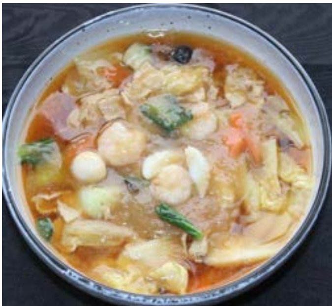
あんかけラーメン