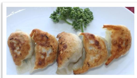
焼き餃子 ¥ 800