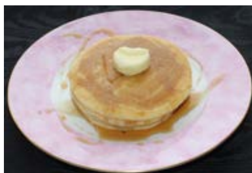
ホットケーキ ¥ 550