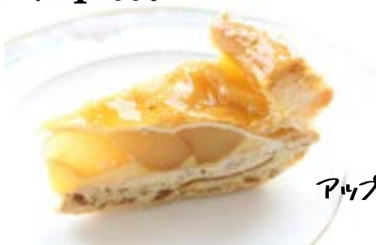
アップルパイ ¥ 600