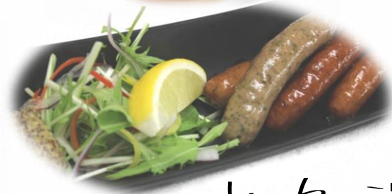
レーザー皿盛合せ