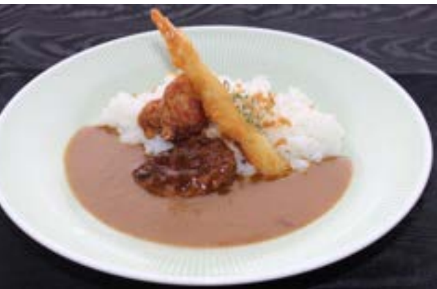
お子様カレー (甘口) ¥ 700