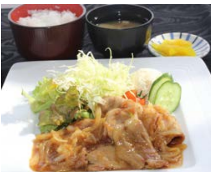
しょうが焼き定食