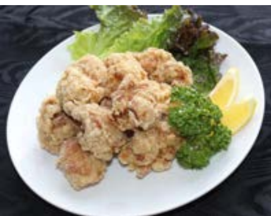
ザンギ ¥ 990