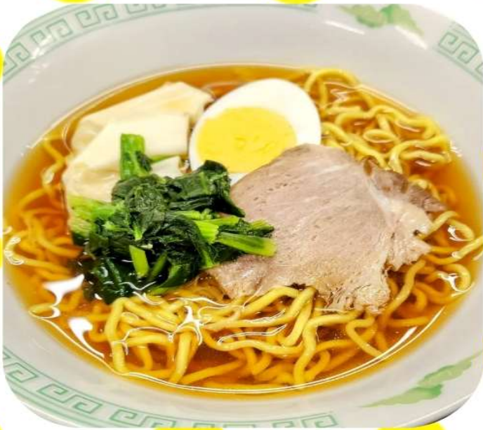
お子様ラーメン (醤油)