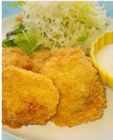
ホタテフライ定食

当店自慢の手ごねハンバーグを、自家製のトマトソースで煮込んだ、ご飯によく合うひと皿です。