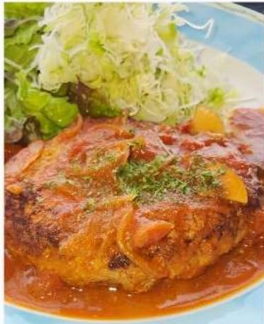
煮込みハンバーグ定食